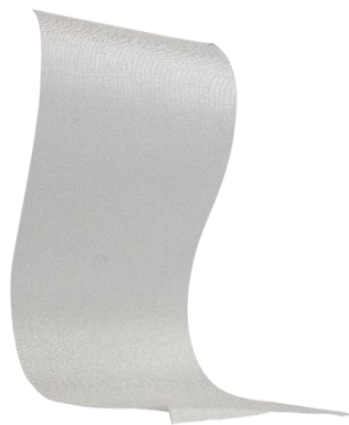
P441 | 96cm