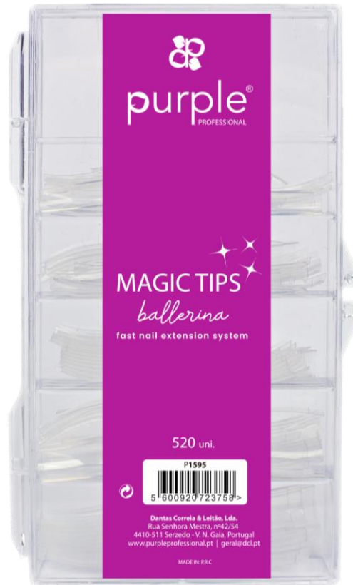
P1595 | 520 uni